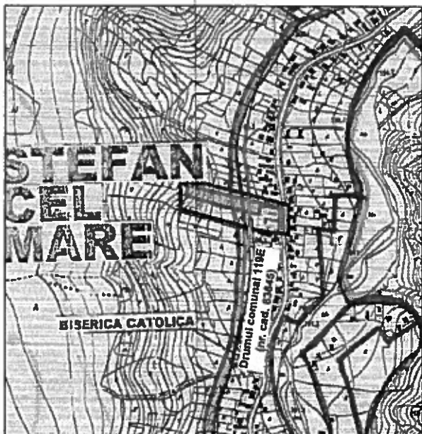
● - AMPLASAMENT STUDIAT